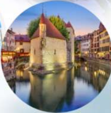
Annecy & Chamonix